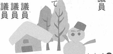
このイラストの意味がわかるかな。(答えはウラ面に)