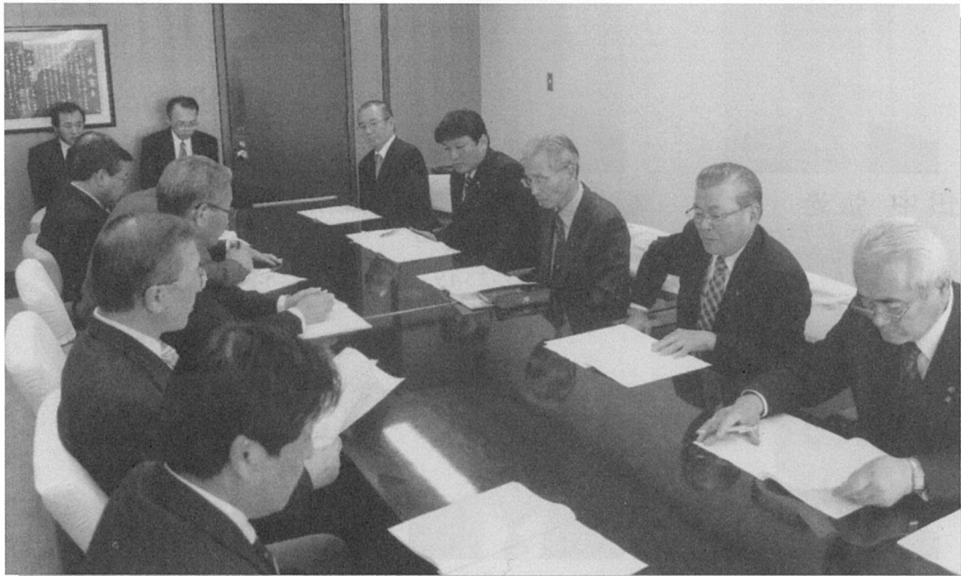
▲平成22年度 予算編成要望