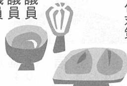
このイラストの意味がわかるかな。(答えはウラ面に)